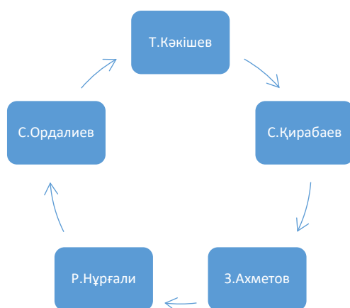
С.Сейфуллиннің өмірі мен шығармашылығының хронологиялық кестесі:

«Кластер» әдісі арқылы С.Сейфуллин шығармашылығын зерттеген ғалымдарды топтастырып көрейік.